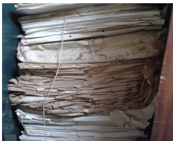
Figura 5. Papeis avulsos com sobrecarga