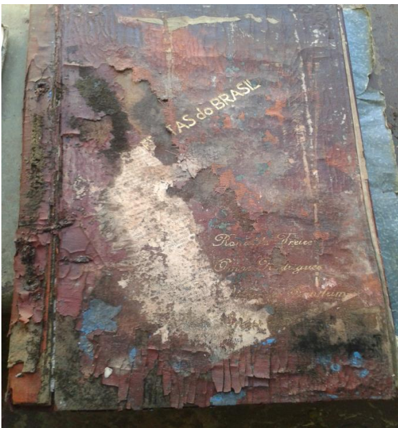
Figura 10. Capa úmida e com fungos