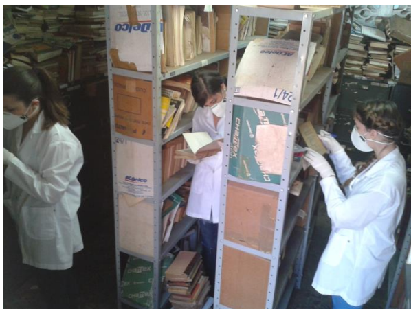
Figura 6. Disposição geral da sala 01