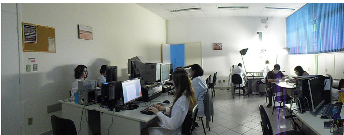
Figura 2. Trabalho dos estagiários no Centro

No que tange à criação dos index , valemo-nos de descritores estabelecidos após a leitura técnica e análise das obras. Além dos conceitos ou aspectos principais do documento, são elencados outros dados relevantes para a descrição, respeitando os preceitos de coerência, concordância, imparcialidade, especificidade, multiplicidade, fidelidade e bom senso. Ao aliar esses preceitos descritivos ao conhecimento específico de uma temática em fonte específica, elaboram-se verbetes, compostos, majoritariamente, de nome, data, acervo de origem, referência, verbete de índice e texto acerca da fonte. O trabalho de confecção desses verbetes configura, portanto, a conjunção entre conhecimento arquivístico técnico e reflexão histórica, onde fontes, historiografia e dados de formato são reunidos.