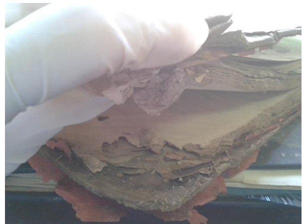
Figura 14. Encadernação e miolo úmidos