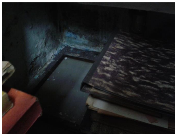
Figura 4. Acervo exposto em solo úmido