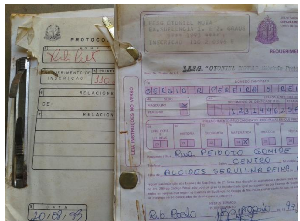
Figura 13. Presença de grampos e outros metais que oxidam a médio/longo prazo