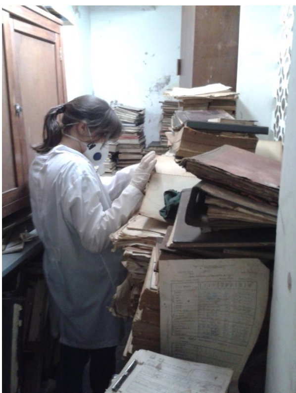
Figura 7. Visão geral da sala 02

São medidas necessárias à reserva técnica: