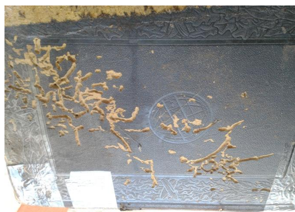
Figura 8. Capa com ação de traça

Do mesmo modo que o espaço de guarda, o acervo XXXXXXXXXXXXXXXX encontra-se em estado avançado de deterioração. Os papéis – sejam eles encadernados ou não – apresentam, em sua maioria, umidade, presença de fungos, vestígios de urina de gato, corrosão por traças, oxidação de grampos, acidificação, entre outros. As figuras abaixo dão-nos um panorama geral dos suportes: