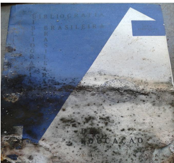
Figura 11. Fungos ativos em papel