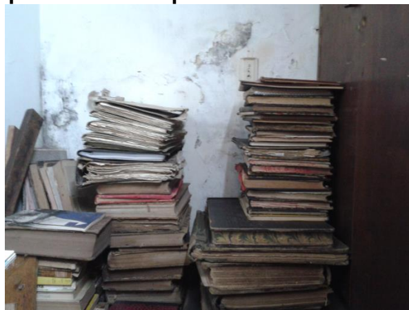
Figura 3. Umidade na estrutura e nos suportes

A inspeção inicial do local de guarda revelou a existência de inúmeros fatores de risco para o acervo e seus consulentes. Localizada no porão da instituição, a reserva técnica majoritária dos suportes possui alto teor de umidade (ver figuras 01 e 02), fatores biológicos de degradação – presença de fungos, traças, pequenas aranhas e um gato, esse último residente fixo do local de guarda –, ventilação proveniente de uma janela basculante/gelosia que tem contato direto com uma das prateleiras (a única em madeira) do acervo, vestígios de penas de ave e alta acumulação de poeira e resíduos.