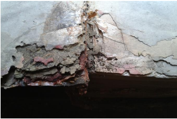
Figura 9. Papel úmido e acidificado