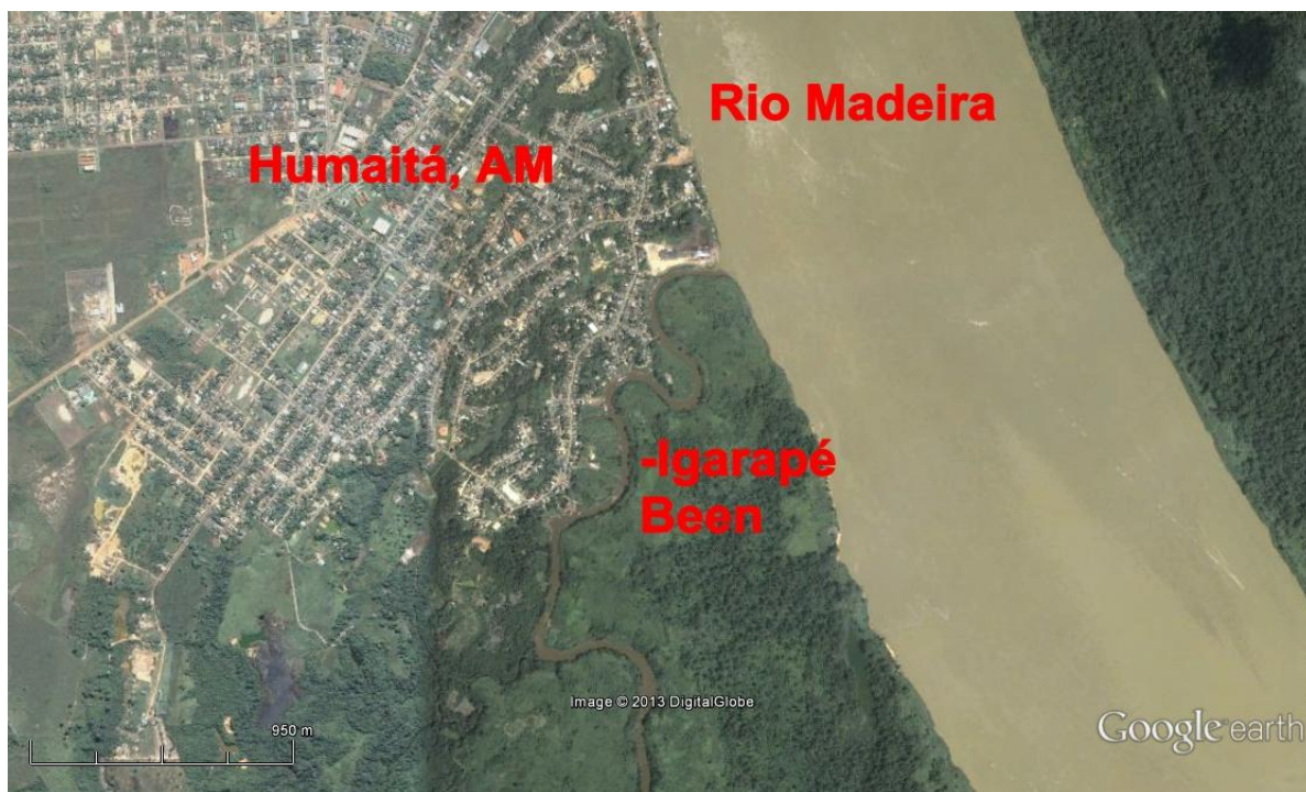
Figura 1. Igarapé Been, com acesso pelo rio Madeira, no município de Humaitá, AM.

A cidade de Humaitá está situada no sul do Estado do Amazonas e possui uma hidrografia privilegiada, não só utilizada para o escoamento da pesca regional, mas também como meio de transporte. O igarapé Been passa lateralmente ao município e sofre forte influência antrópica durante seu trajeto, pois recebe grande quantidade de esgoto sem tratamento (Figura 1).