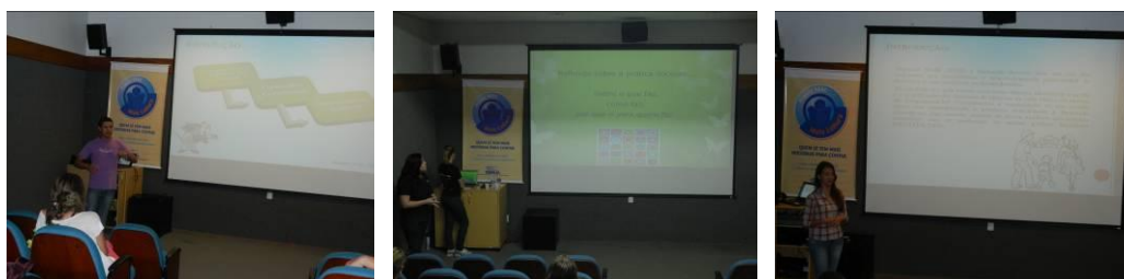
Figura 5. Acadêmicos bolsistas do programa apresentando os resultados do programa e suas percepções sobre a experiência.

Etapa 4 (20h): Ao final do programa foi realizado um seminário de compartilhamento de experiências, no qual os alunos de graduação componentes da equipe executora e os professores participantes, apresentaram resultados de sua participação no programa. Os alunos, graduandos dos cursos de Enfermagem, Fisioterapia, Licenciatura em Educação Física e Licenciatura em Ciências da Natureza, discorreram sobre a sua percepção ao longo do trabalho e a experiência de participar na capacitação, e apresentaram os resultados observados (Figura 5).