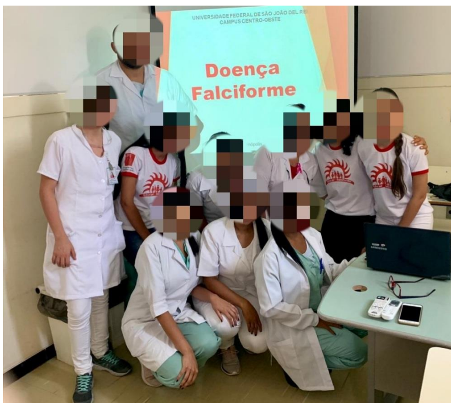
Figura 4. Capacitação com os profissionais da saúde do Pronto Atendimento.