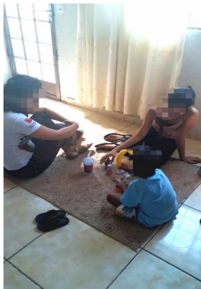
Figura 3. Intervenção educativa com o Brinquedo Terapêutico.