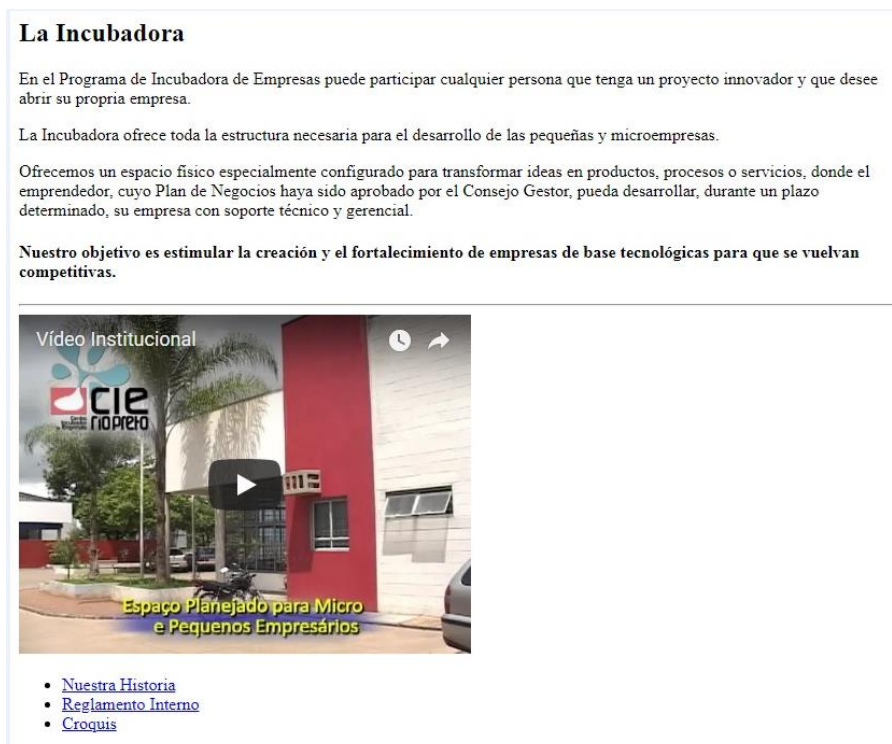
Figura 3. Página inicial do Centro Incubador de Empresas de São José do Rio Preto em língua espanhola.