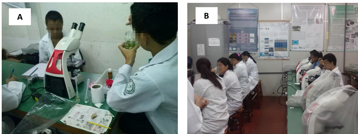
Figura 1. A. Acadêmico da UFAM preparando material utilizado na aula de Citologia/Histologia para os alunos do ensino médio do IFAM. B. Alunos do ensino médio do IFAM participando de uma das aulas práticas.

As práticas de Citologia e Histologia neste projeto de extensão permitiram a consolidação do manual de protocolos criados para aulas práticas de Citologia e Histologia do curso de Ciências Naturais da UFAM.