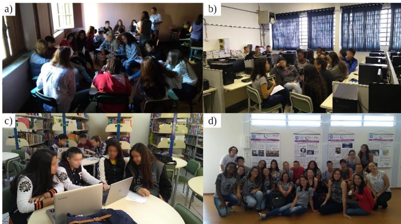
Figura 1. Algumas atividades realizadas em 2018. a) Coleta de dados na Escola 3. b) Discussões na Escola 2. c) Preparação para as apresentações na Escola 1. d) Parte dos estudantes participantes durante o ENSET 2018, com os painéis apresentados ao fundo.

Durante o ano de 2019, as etapas do trabalho foram similares às do ano anterior, com a diferença que o foco das atividades foi o trabalho de mulheres atuantes na atualidade, desenvolvendo atividades de difusão de conhecimentos sobre o trabalho de cientistas e engenheiras mulheres com atuações relevantes na academia e na indústria. Inicialmente, realizaram-se pesquisas bibliográficas para identificar mulheres profissionais com destacada atuação nas ciências e engenharia, selecionaram-se as que seriam apresentadas aos estudantes do ensino médio e preparou-se o material de divulgação, incluindo material para ser veiculado através das redes sociais do projeto. No primeiro semestre foram realizadas cinco visitas a duas escolas, trabalhando com 21 estudantes do 3º ano do ensino médio e 37 estudantes do 2º ano do ensino médio, um total de 58 meninos e meninas com idade média de 16,15 anos.