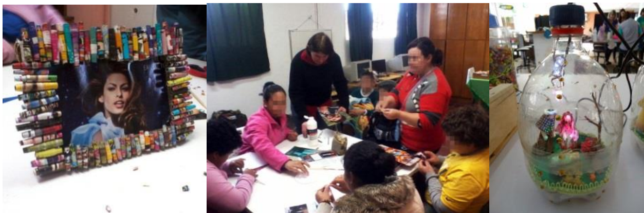
Figura 5. Oficina de porta-retratos e mini presépio.

Em outro módulo de oficinas, as meninas foram convidadas a aprender técnicas de modelagem, papel machê, e pintura. O produto final foi uma boneca com corpo de garrafa PET e com cabeça e braços de papel. Com as técnicas empregadas um novo produto foi criado, a partir de um material considerado sucata.