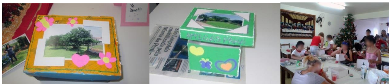
Figura 4. Oficina de porta-objetos customizáveis e resultados.

A ideia do porta-objetos surgiu a partir de visitas, quando se observou que as necessidades das moradoras iam além de suprimentos e questões de saúde. Para as oficinas, optou-se pelo melhor aproveitamento da folha de papel cartão, e foi revestido com a técnica de papel machê. Pelo fato de ser simples, ter baixo custo e sem restrição, poderia ser decorada conforme a preferência de cada uma, com ou sem ajuda dos assistentes, e teve a função de resgatar a individualidade. Além disso, possibilitou-se que fosse anexada junto da tampa uma foto pessoal, produzida pela equipe do projeto de extensão, ou de familiares, pessoas próximas, paisagens ou animais. O resultado da atividade no CECRIFE pode ser verificado na figura 4: