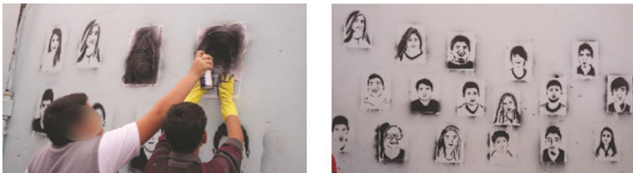
Figura 10. Aplicação e resultado do estêncil.

A implementação do projeto se deu inicialmente através de uma oficina de história da arte e fotografia, onde se aliou a teoria com a prática e se estimulou o grupo a fotografar seus colegas. A partir das fotografias digitais foram produzidos moldes vazados, através da técnica de estêncil, dando origem a forma dos retratos pictóricos. Ao final, os retratos foram grafitados em diversos suportes, em papel sulfite A3 e até mesmo em paredes da escola.