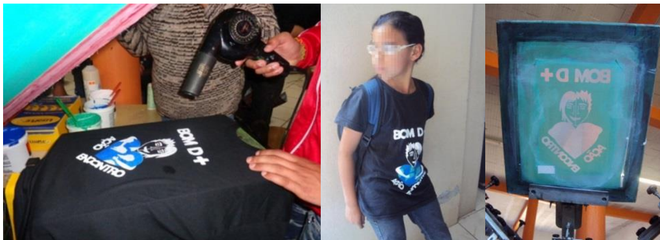
Figura 3. Oficina de serigrafia e resultado.

Essa síntese consolidou-se no quarto e último encontro, em uma oficina de serigrafia em camisetas, na qual cada integrante pôde compreender o processo e aplicar a identidade visual da turma em sua peça. Para a realização desta atividade, o projeto recebeu apoio da diretora e de um educador da Ação Encontro, além de parceiros da associação na doação das camisetas, e também de uma voluntária da comunidade para a operacionalização da serigrafia, conforme a figura 3.