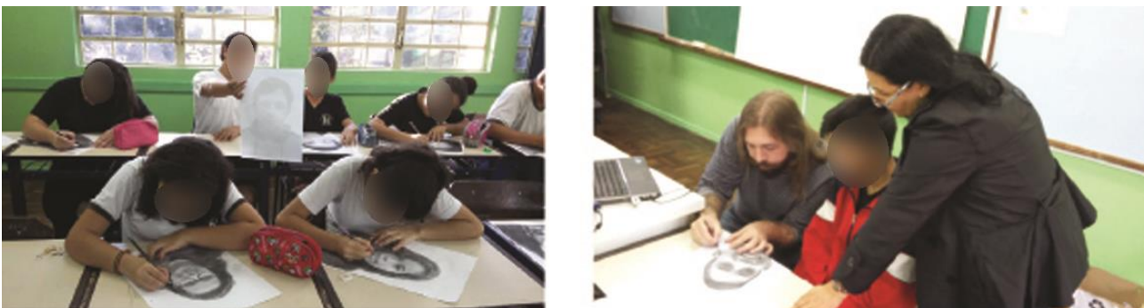
Figura 9. Oficinas de estêncil na escola. À direita, bolsista e professora orientam aluno.

Primeiro, houve uma visita à instituição, e percebeu-se a carência socioeconômica na comunidade. Em meio a esse contexto, observou-se que o principal objeto de interesse dos alunos era a combinação entre as possibilidades oferecidas pelas mídias digitais com o desenvolvimento de técnicas manuais. Posteriormente, a equipe extensionista 21 reuniu-se para a etapa de brainstorming , quando foram propostas diferentes ideias para a construção da atividade, buscando alternativas que despertassem o interesse dos alunos, visando estimular autoestima, expressão, e promover valores de senso de coletividade e pertencimento. A solução escolhida e aprovada em conjunto com o professor da matéria de Educação Artística e a coordenadora da escola, para atuação junto a uma turma de 25 alunos do 7º ano, foram as oficinas de desenvolvimento de retratos pictóricos, em específico autorretratos, provenientes da combinação de técnicas de fotografia digital e estêncil, como pode ser visto na figura 9: