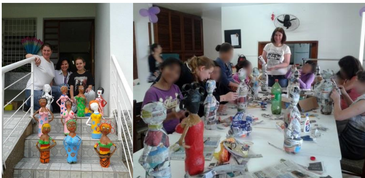
Figura 6. Oficina de produtos artesanais decorativos e resultado. Acadêmicas voluntárias e professora com o resultado, à direita.

Em outro módulo de oficinas, as meninas foram convidadas a aprender técnicas de modelagem, papel machê, e pintura. O produto final foi uma boneca com corpo de garrafa PET e com cabeça e braços de papel. Com as técnicas empregadas um novo produto foi criado, a partir de um material considerado sucata.