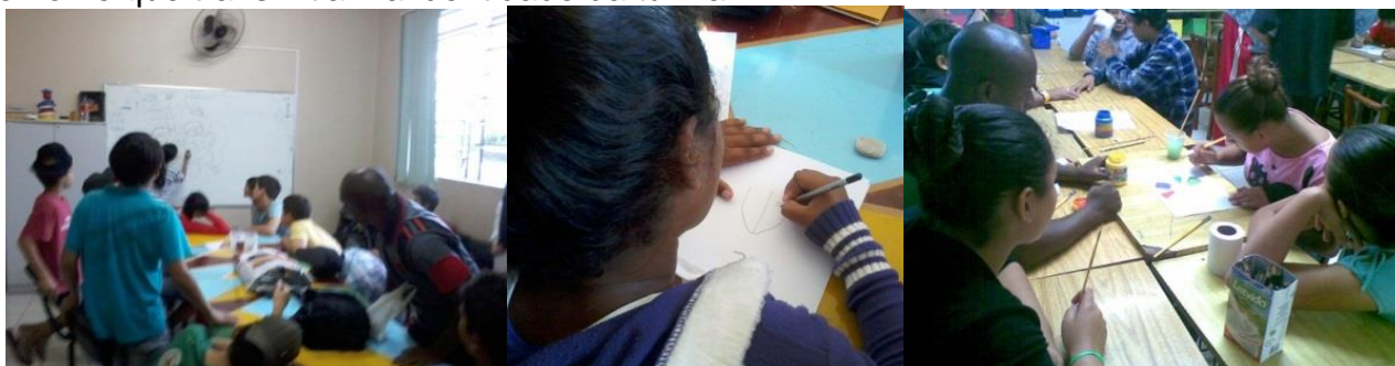
Figura 2. Desenho da turma, oficina sobre cores e layout final para serigrafia.

A segunda oficina tratou sobre teoria da cor, com ênfase no Disco de Newton, e em conceitos como cores análogas, complementares, pregnância visual e contraste. Além disso, foram analisadas as imagens de pinturas de artistas expoentes do Vale dos Sinos 13 . Na terceira oficina, cada aluno realizou um desenho representando os valores e identidades discutidos nos encontros anteriores. Praticou-se ainda um exercício de naming - criação de nome, para o grupo. Por votação, escolheu-se em conjunto o símbolo e nome que transmitiam a identidade da turma.