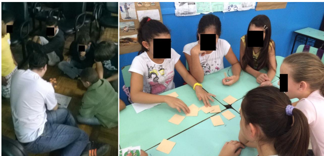
Figura 2. Alunos participando das atividades da ação Saúde do Cérebro - Jogo do tabuleiro e jogo da memória.