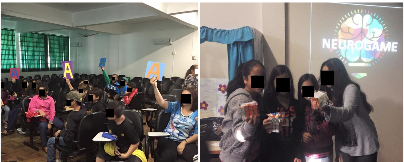
Figura 4. Alunos participando das atividades da ação Plasticidade Cerebral - Neurogame e equipe vencedora de uma das escolas com seus cubos mágicos.

Esta atividade consistiu em um jogo de perguntas e respostas retomando conceitos trabalhados durante as ações descritas. O jogo continha questões consideradas fáceis, médias e difíceis, as quais valiam, respectivamente, 1, 2 e 3 pontos (figura 4). Os alunos foram divididos em grupos para responder as questões, que foram apresentadas por meio de projeções. Cada questão foi apresentada com três opções de respostas e os grupos de alunos possuíam placas que deveriam ser levantadas para indicar a resposta correta. O grupo que obteve maior pontuação foi premiado com cubos mágicos, um jogo que envolve desafio cerebral.