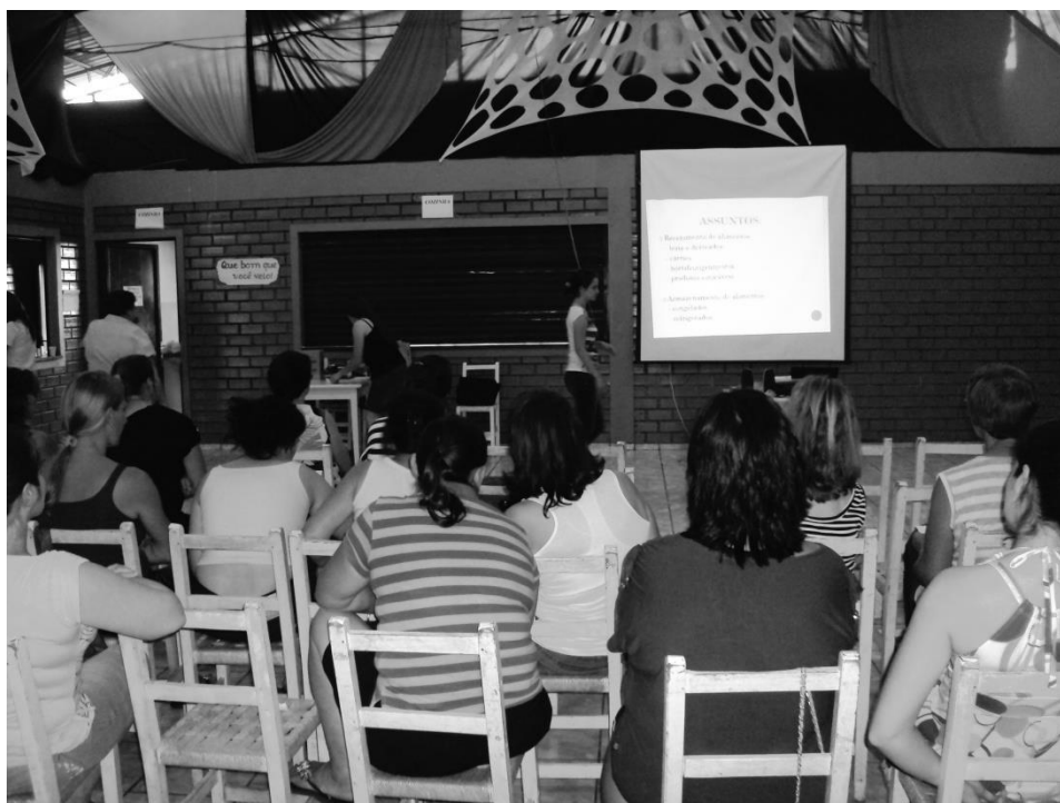
Figura 2. Momento inicial do curso, no qual as acadêmicas mostram ao público os assuntos a serem abordados – Capanema – PR, 2012.

Na sequência, as acadêmicas iniciavam a parte teórica do curso (mesclada a dinâmicas e práticas), mostrando os assuntos a serem abordados. A Figura 2 ilustra este momento, ocorrido Capanema – PR.