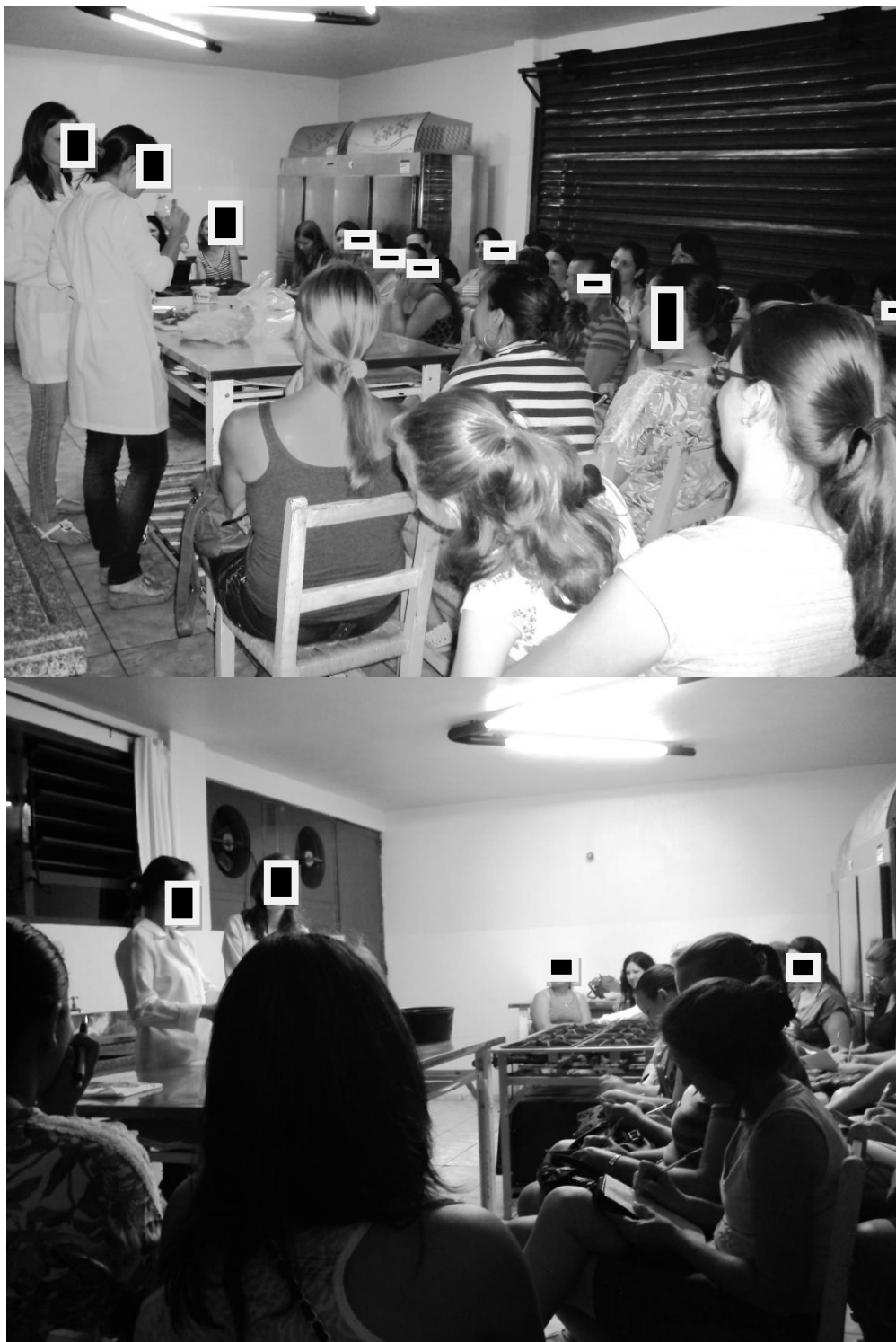
Figura 3. Dinâmica de recapitulação dos conteúdos ministrados, no último do curso em Santa Izabel do Oeste (fotografia de cima) e em Capanema (fotografia de baixo) – PR, 2012.

Considerando os efeitos proporcionados com a realização de treinamento com manipuladores de alimentos, e visando a compreensão destes sobre a importância das boas práticas de fabricação e manipulação de alimentos, Pittelkow e Bitello (2014) avaliaram o efeito deste treinamento com utilização de testes de conhecimento, e