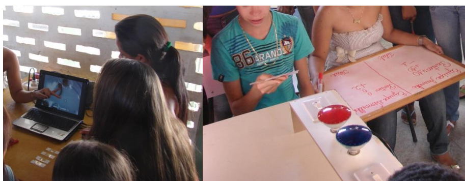
Figura 2. Estação de aprendizagem ( Aedes aegypti , o agente transmissor): utilização da experimentação (demonstração) e jogos.