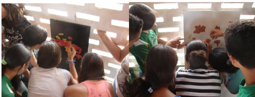
Figura 4. Estação de aprendizagem (Dengue, distribuição no Brasil): utilização da atividade lúdica por meio do jogo e interdisciplinaridade.

3ª Etapa Questões norteadoras para discussão no grupo (consolidação e extrapolação): Quais são os estados que, geralmente, apresentam maior risco para a ocorrência da dengue? Qual é o motivo? Dentro do mesmo estado podemos encontrar cidades com maior risco do que as outras? Qual é o motivo? Além do clima, quais fatores podem contribuir para maior quantidade de mosquitos em uma determinada região do país?