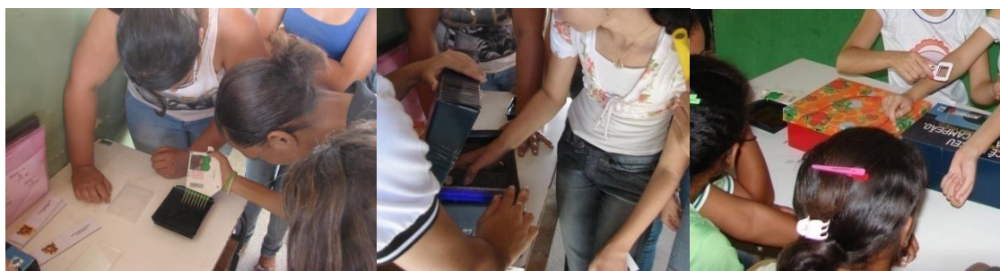
Figura 3. Estação de aprendizagem (Dengue, sinais, sintomas e diagnóstico): utilização da simulação e experimentação problematizadora (ELISA, sorotipagem do vírus e prova do laço).